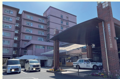
▲横須賀市立うわまち病院