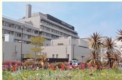
▲横須賀市立市民病院

びょう いん まいにち 病院では毎日いろいろな びょう き や ケガ を した 人 の 治 りょう 療 を して います。救急車 など で 運ばれてくる患者 さん を 診察 したり、手術 を したり、リハビリをして早く元気になるよう たくさん の 人 たち が 働いて います。火事 や 事 故 が 起きた とき には ドクターカー に お 医 者 さん が 乗って 現場 に 行き、命 を 救って います。